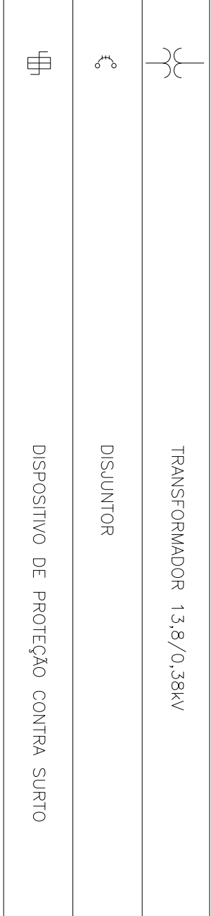
QUADRO GERAL DE DISTRIBUIÇÃO DE BAIXA TENSÃO